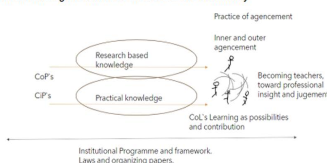
Figure 2. A practice as agencement [4], CoP's [1, 2] and Col's [3] within Communities of Learners [13], Teachers' professional knowledge [14].